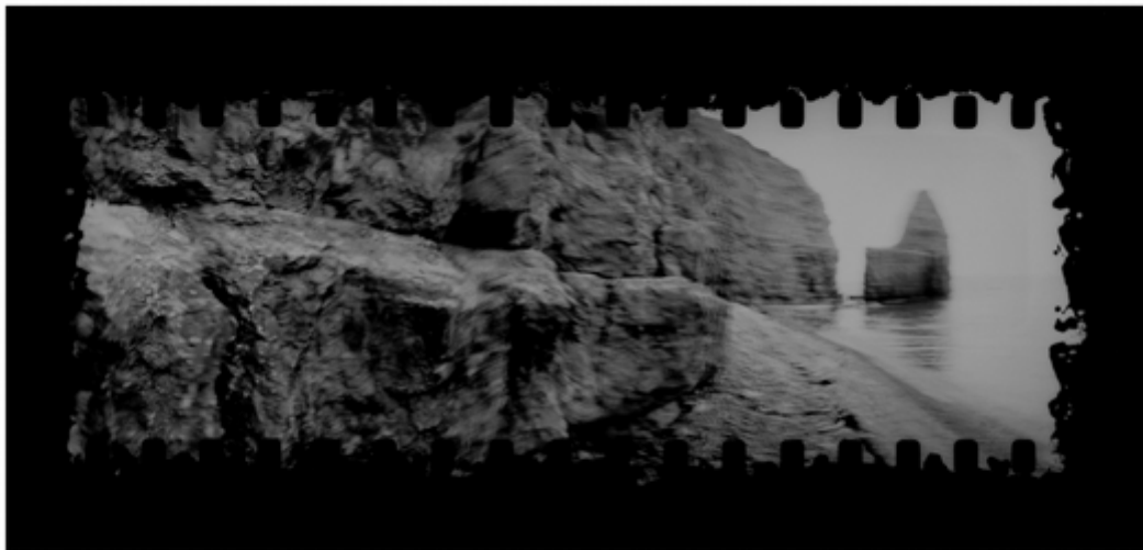
Pointe du Hoc